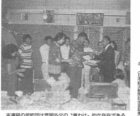
本連盟の使節団は民間外交の「草むけ」的な存在である