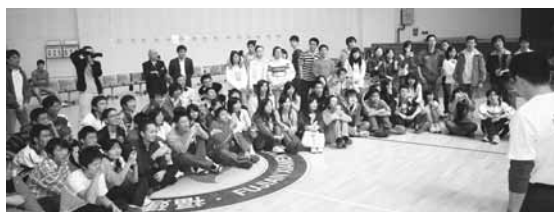
チャンピオンの演技に見入るアモイ大学の参加者。特殊技には歓声が上がった