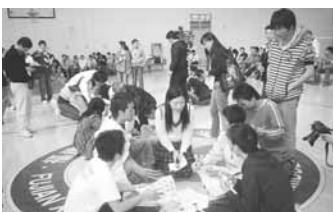
訪中団学生と一緒に、車座になりペインティング