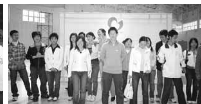
入賞者一同で記念撮影。この後の賞品授与で大騒ぎ