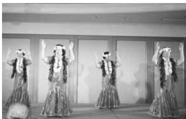
お揃いの衣裳で、見事な舞台。会場からは大きな拍手が