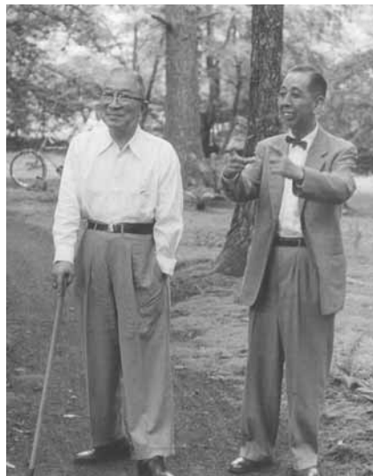
この欄では、機会ある毎に「友愛」に保管されている写真の中から、とっておきの一枚をご紹介します。最初にご登場いただいたのは、「鳩山一郎先生と岸信介先生」。撮影年月日は不明ですが、場所は軽井沢、現友愛山荘の地です。二人で何を話しておられるのでしょうか。お二人のこやかな笑顔が、とても素敵な一枚です。