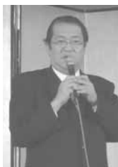
鳩山邦夫 衆議院議員