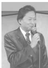
鳩山由紀夫 衆議院議員