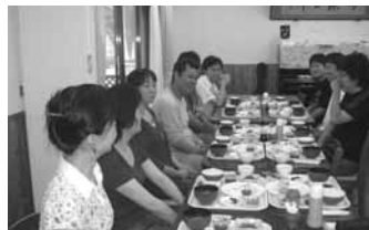
おしゃべりは中国語で? 全員が専門家です