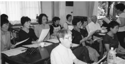
近隣の方々も参加して。皆で声を揃えてドイツの歌を