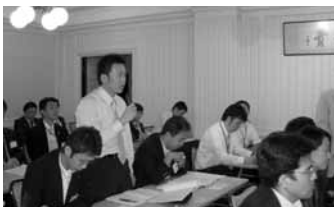
毎回活発な質疑応答が行われる