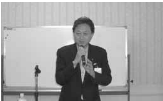
テーマは「友愛」。鳩山由紀夫塾長代行