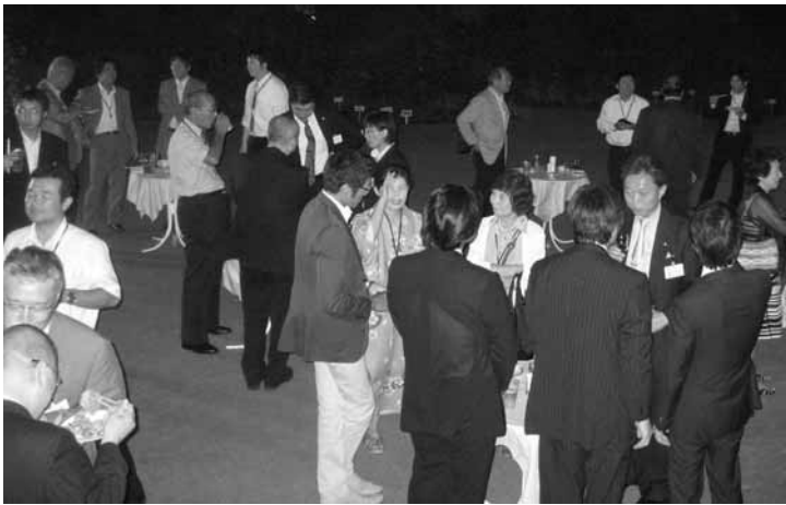
前期講義終了後のビアパーティ。講師・役員・塾生一つになって、鳩山会館の庭で歓談の時をすごした