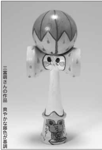
三富萌さんの作品 爽やかな顔色が基調