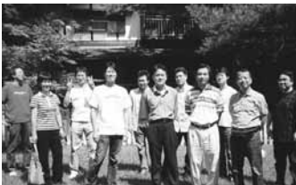
天候にも恵まれ、日差しの中で記念撮影

四月に開塾した「鳩山友愛塾」は、全国から精鋭が集い、月二回の講義には、各界からの第一人者を講師として招き、第一期講義を順調に展開している。(関連記事三回)