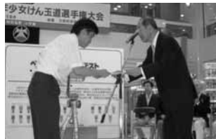
個人、他、三団体に友愛賞が贈られた