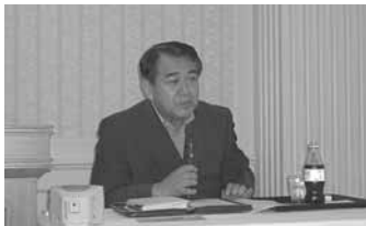
豊富な資料、具体的な講義内容 寺島実郎先生