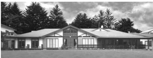
友愛山荘の庭より建物を望む。シンメトリーの建物が独特の雰囲気を出している