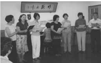
発表会、少し緊張。軽井沢に素敵な歌声が