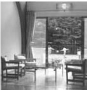
庭を見晴らせるロビー

軽井沢友愛山荘 十一月末まで利用できます 大いに活用を! 今号の特集でご紹介した軽井沢友愛山荘は、十一月末までご利用いただけます。秋の紅葉の季節は特にオススメです。申し込み・お問い合わせは事務局までどうぞ