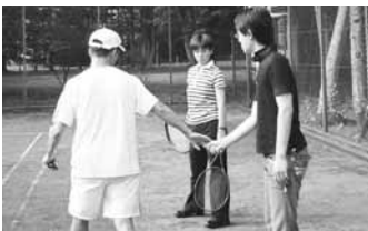
名コーチ、迷生徒も現れ、和気藹々の練習