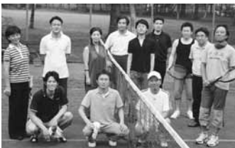
大激戦の後、テニスコートで。いい汗かいた!