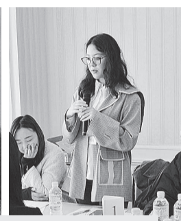
自らの言葉で、想いを、意見を伝える留学生のみなさん 個性豊かな話題が