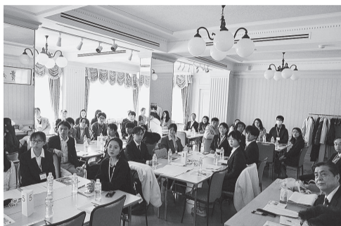
会場は和やかさの中にも熱気が溢れ、若いエネルギーが楽しそうに討論を交わっていた