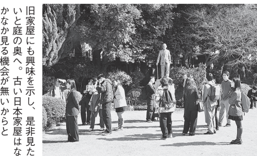
暖かい日差しの中、思い思いに庭を見学。バラの咲く頃には是非もう一度訪れたいと口を揃えていた