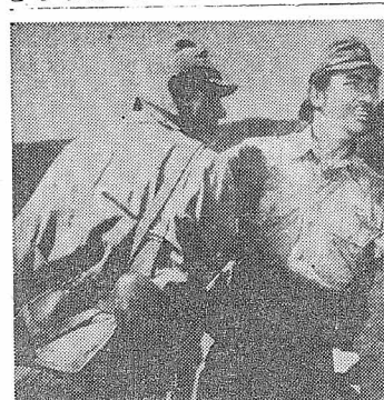
【文芸作品映画「日の果りのシーン」】